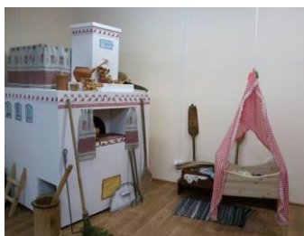
«Семейный читальный зал Домовенок» ТОС «Забота» МО «Уемское»