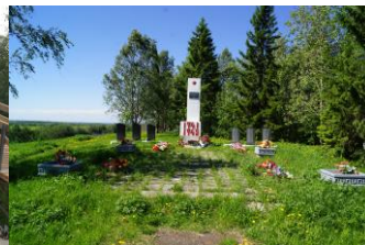
Восстановление обелиска Победы ТОС «Уемские дворики» МО «Уемское»