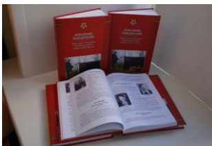
«Поколение победителей» ТОС «Наследие Заостровья» МО «Заостровское»