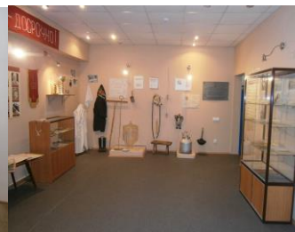
Музей коровы ТОС «Совет деревни Хорьково» МО «Боброво-Лявленское»