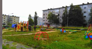
«Счастливое детство» ТОС «Возрождение» МО «Лисестровское»

Администрация муниципального образования «Приморский муниципальный район»