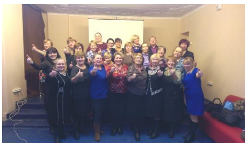
III конференция ТОС Приморского района 04 декабря 2015 года